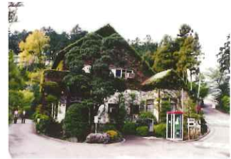
当時の福祉クラブ